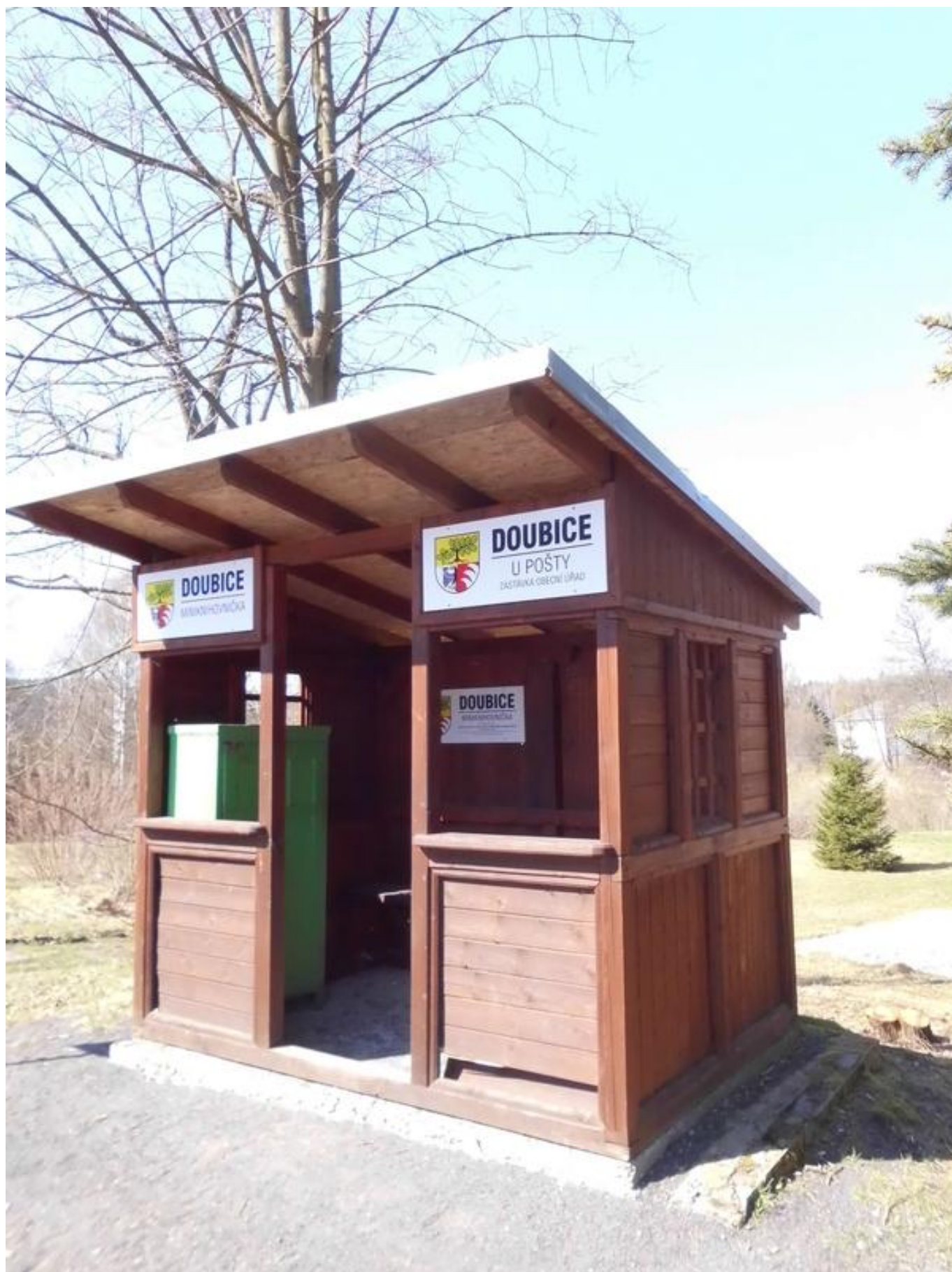
[9] Celkový pohled