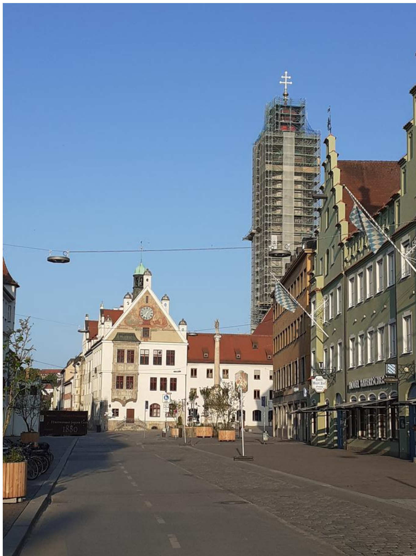
[53] Ve Freisingu