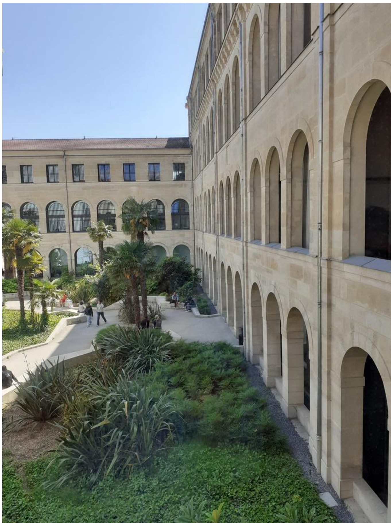
[38] Pohled do zahrady