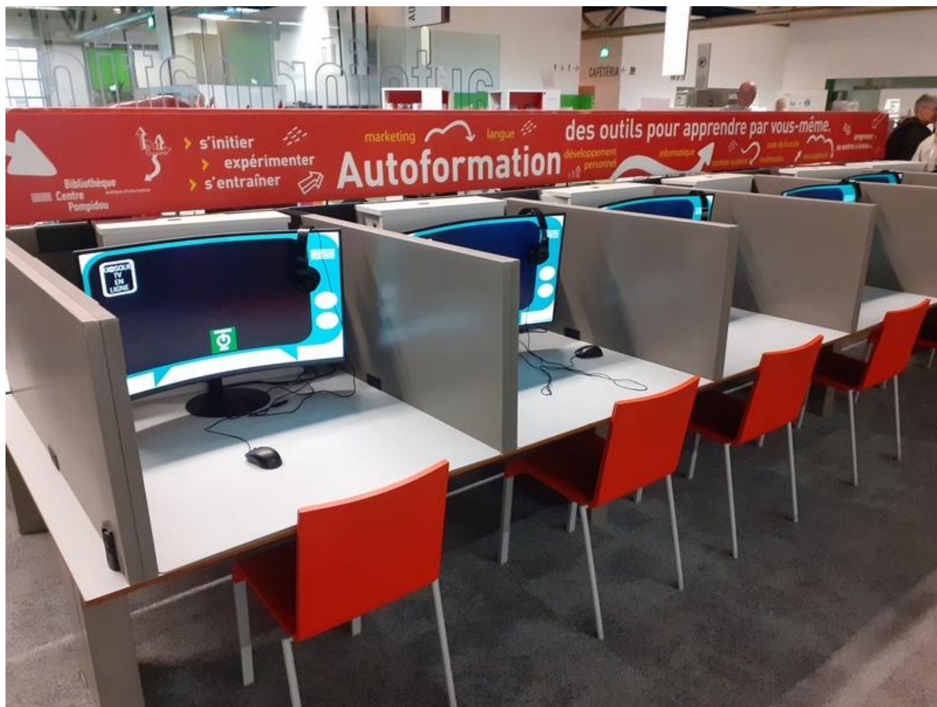
[18] V knihovně nemohou chybět počítače