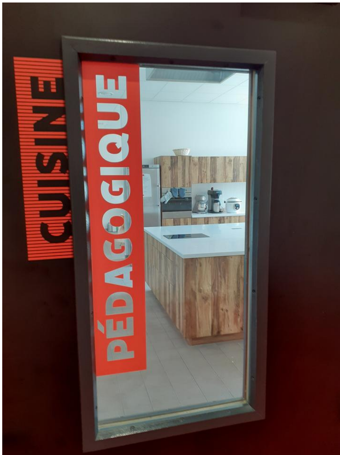
[26] Cvičná kuchyně