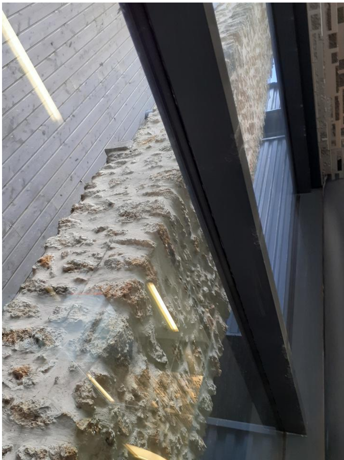
[31] Jeden z nosných pilířů