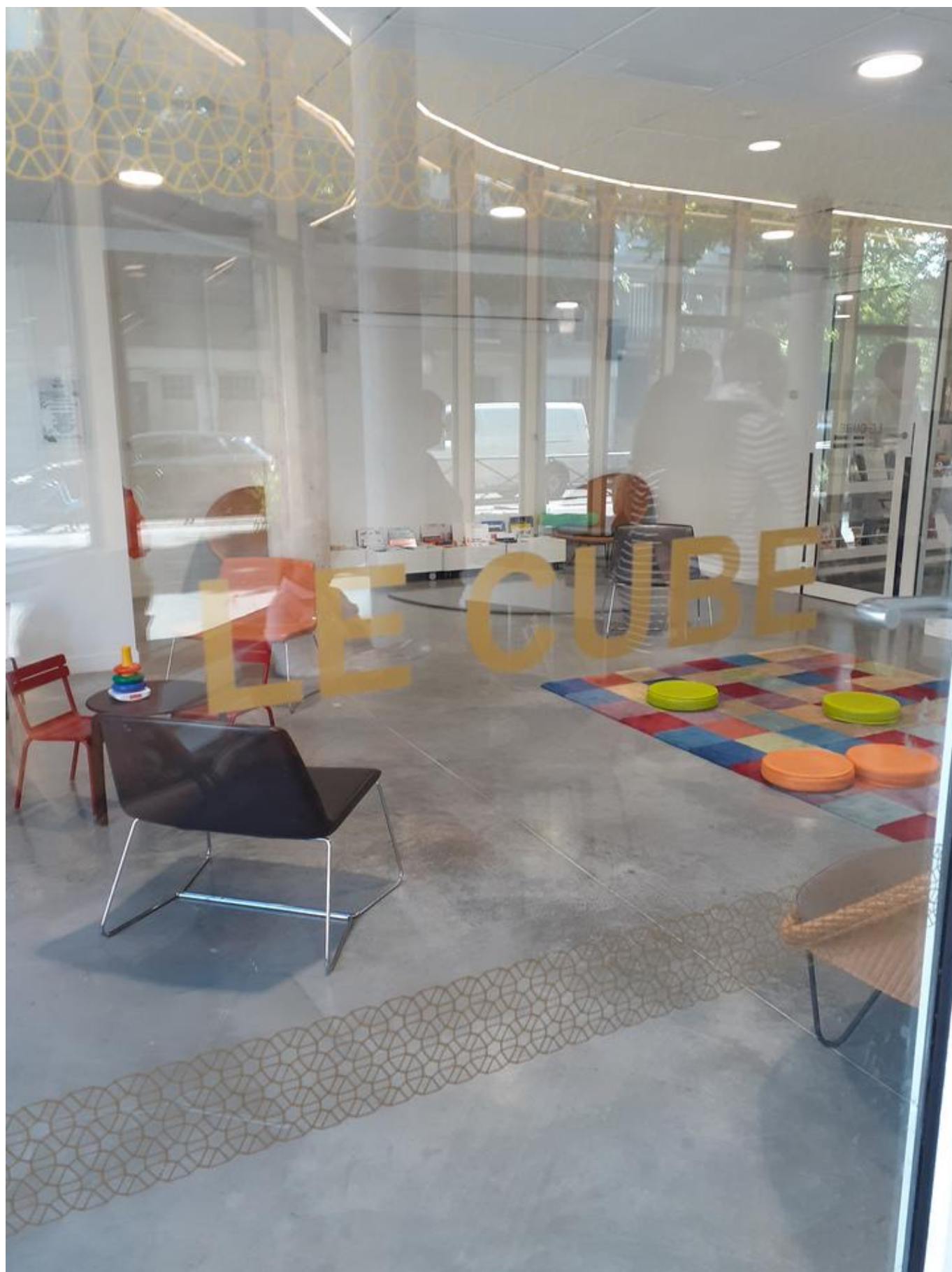
[35] Dětský koutek