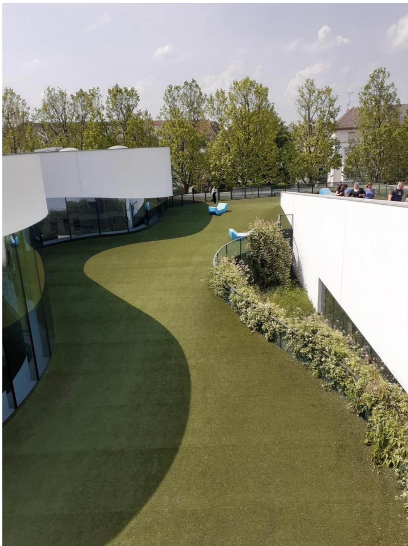
[12] Dokonalé propojení budovy s okolím