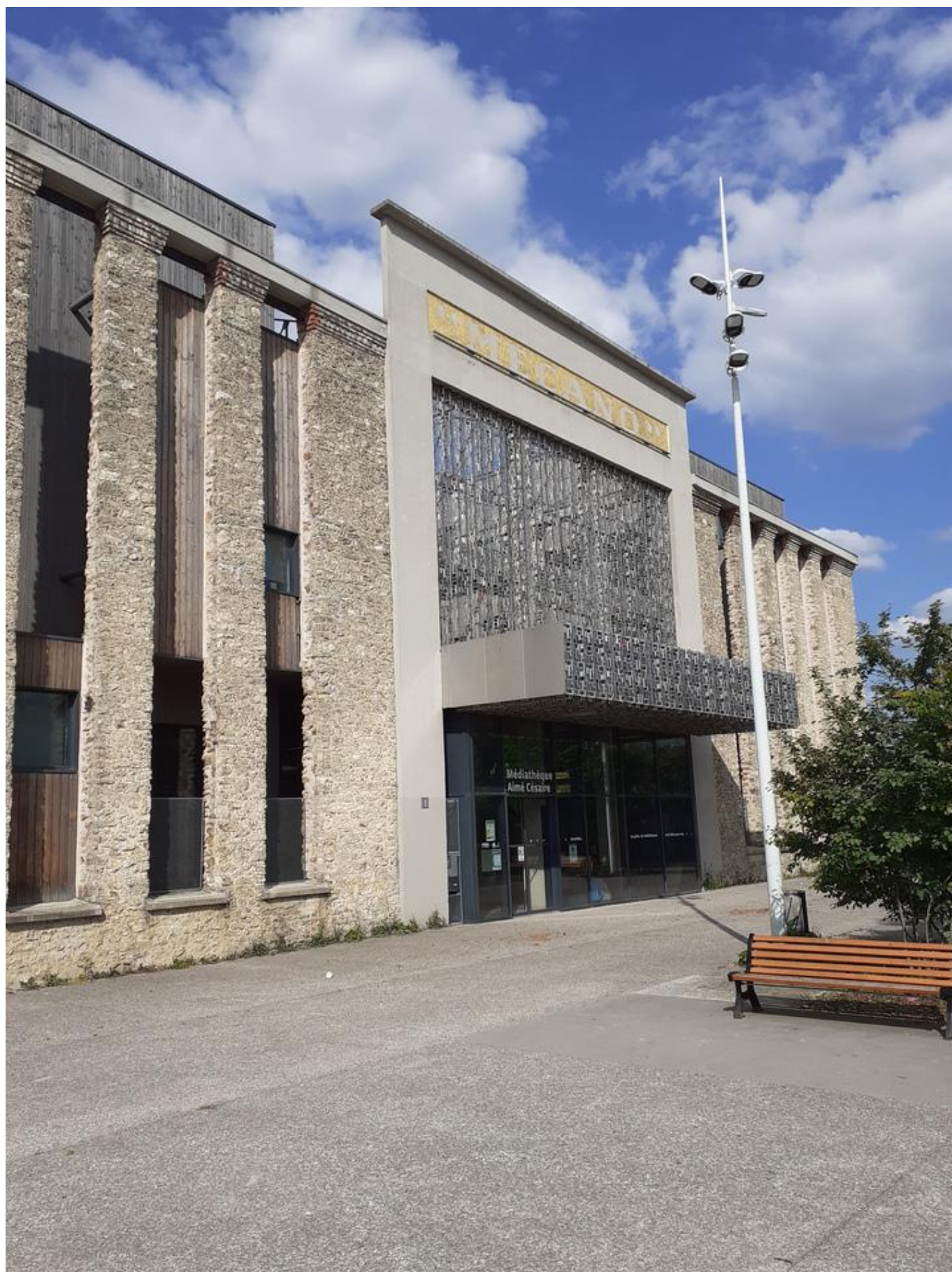
[29] Mediatéka v Courneuve