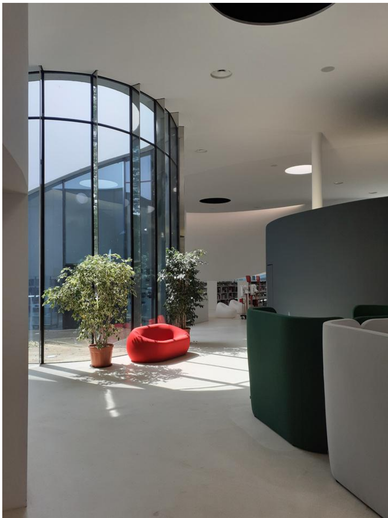
[11] Pohled do interiéru knihovny Puzzle