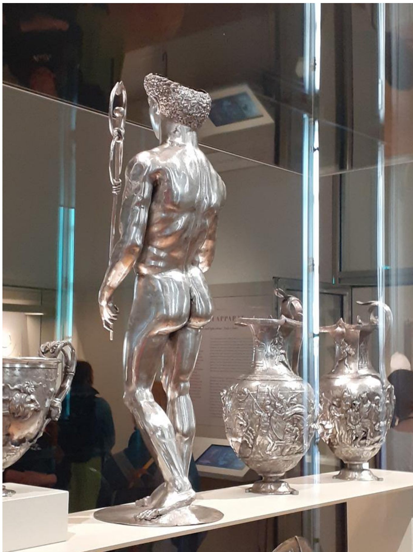
[49] Muzejní exponáty ze sbírek Národní knihovny Francie