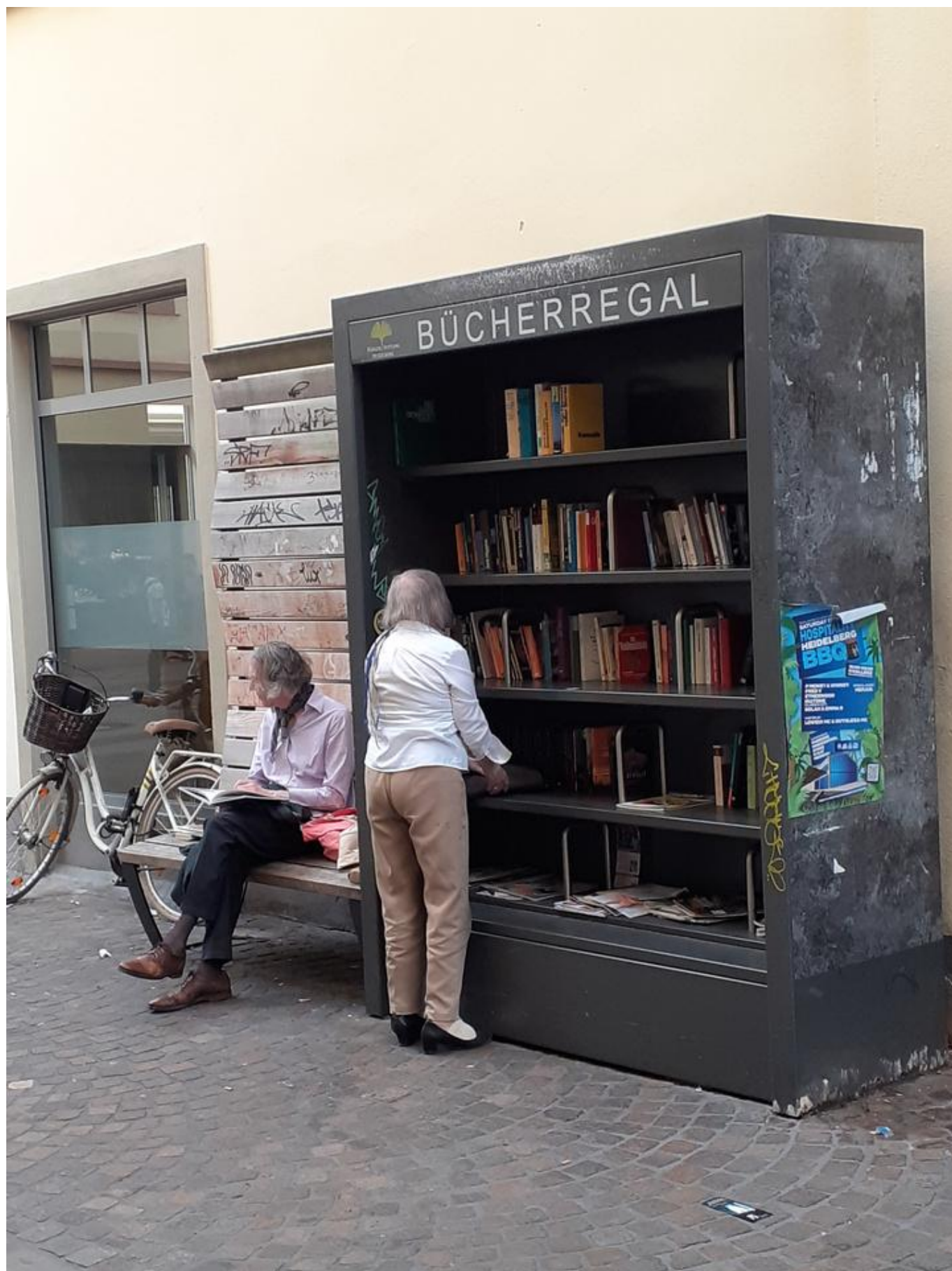
[8] Jedna z heidelberských knihobudek