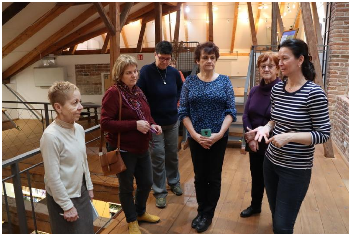
[14] V galerii

Nejvíce však na knihovně zaujme její působení v městské části. Cokoliv se v Dolních Chabrech děje (a není toho málo), tam se podílí na přípravě a realizaci dvě pracovnice knihovny. Nejde jen o obvyklé akce pro školu, besedy a návštěvy jednotlivých tříd. Pro děti se koná řada soutěží, workshopy, Noc s Andersenem, vyrábějí zde všechno možné od záložek do knih po krmítko, na prostranství před budovou se pasují děti na čtenáře - to je jen malý výběr z řady aktivit na podporu čtenářství.