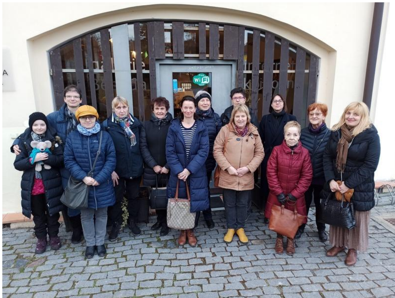
[20] Společná fotografie účastníků exkurze