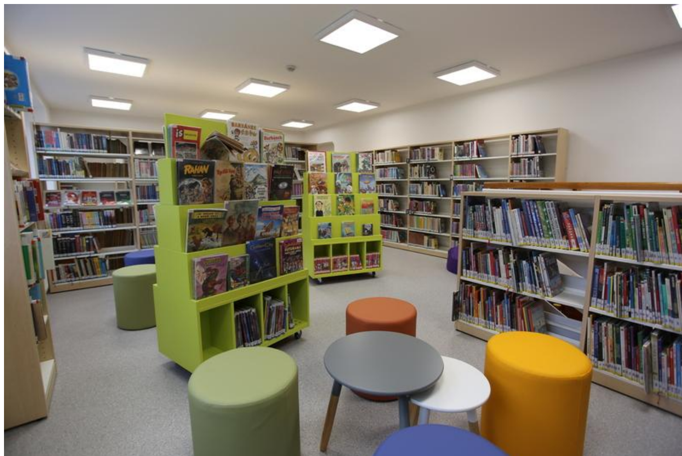
[13] Oddělení pro děti a mládež