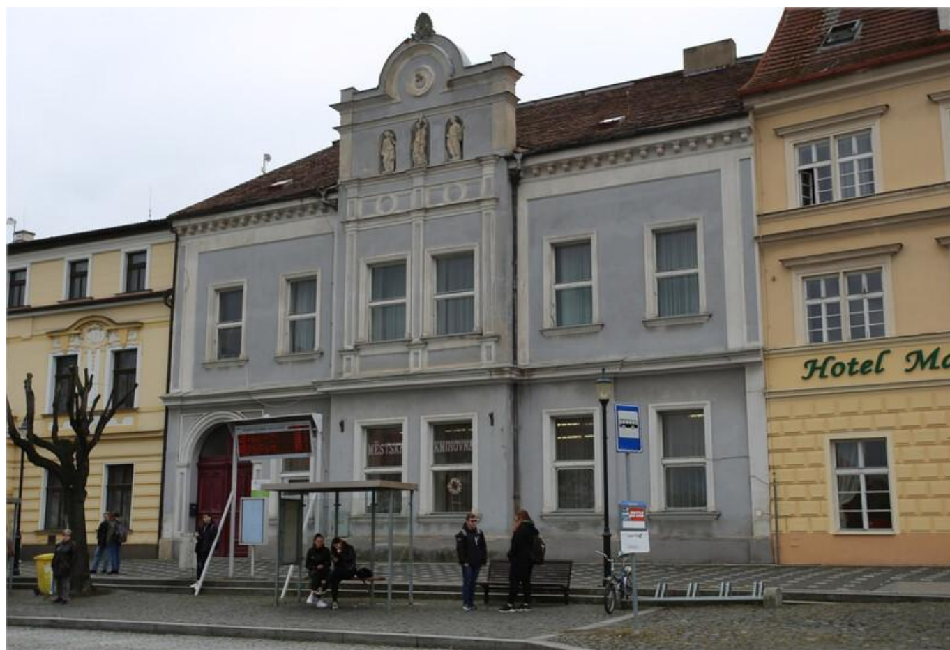
[9] Před rekonstrukcí

výměnu oken a dveří, kompletní výměnu elektroinstalace a osvětlení, položení nových podlahových krytin a změnu dispozice sociálních zařízení včetně toalet pro osoby s omezenou schopností pohybu.