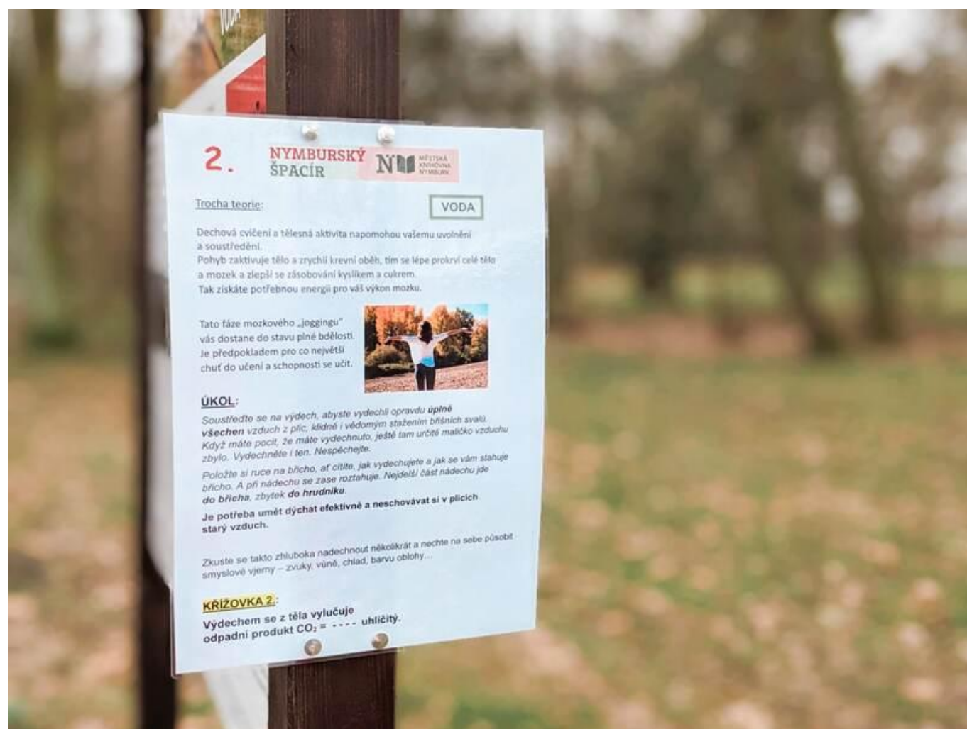
[16] Zhluboka dýchat!