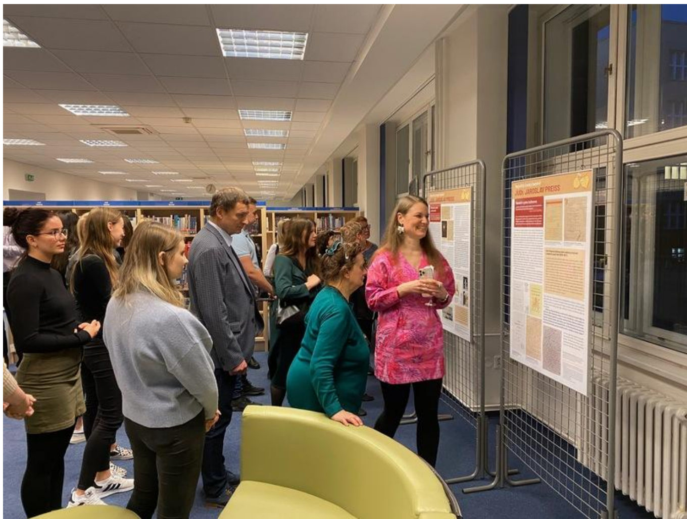
[24] Prohlídka výstavy ve studovně

Výstava se zaměřuje na vztah mezi hospodářstvím a kulturou, přibližuje bankéřovy postoje i mecenášské aktivity a lásku ke knihám. Cílem expozice je rovněž ukázat, že dějiny českého hospodářství a ekonomického myšlení obsahují nadčasové podněty, které mohou inspirovat i v dnešní době.