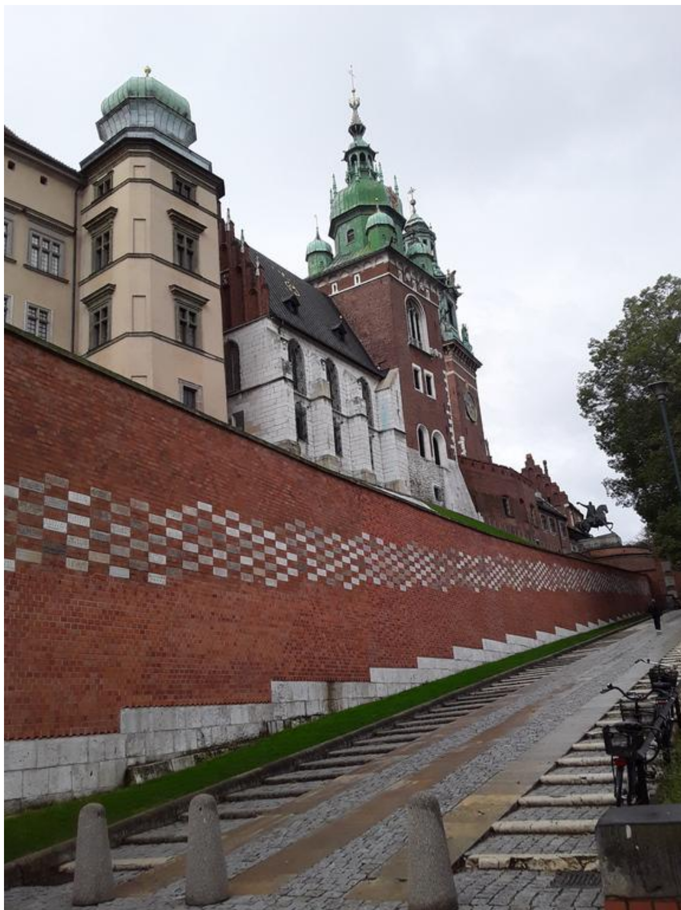
[8] Dominantou Krakova je hrad Wavel