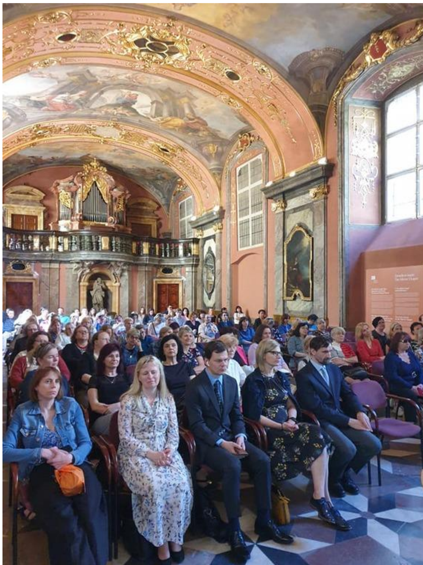
[36] Účastníci konference SONS a knihovny