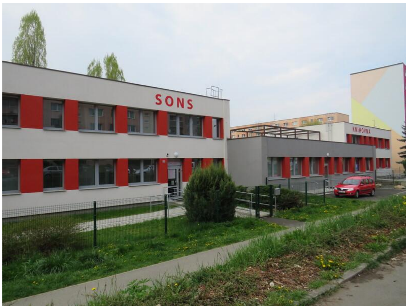
[17] Vlevo SONS, vpravo knihovna