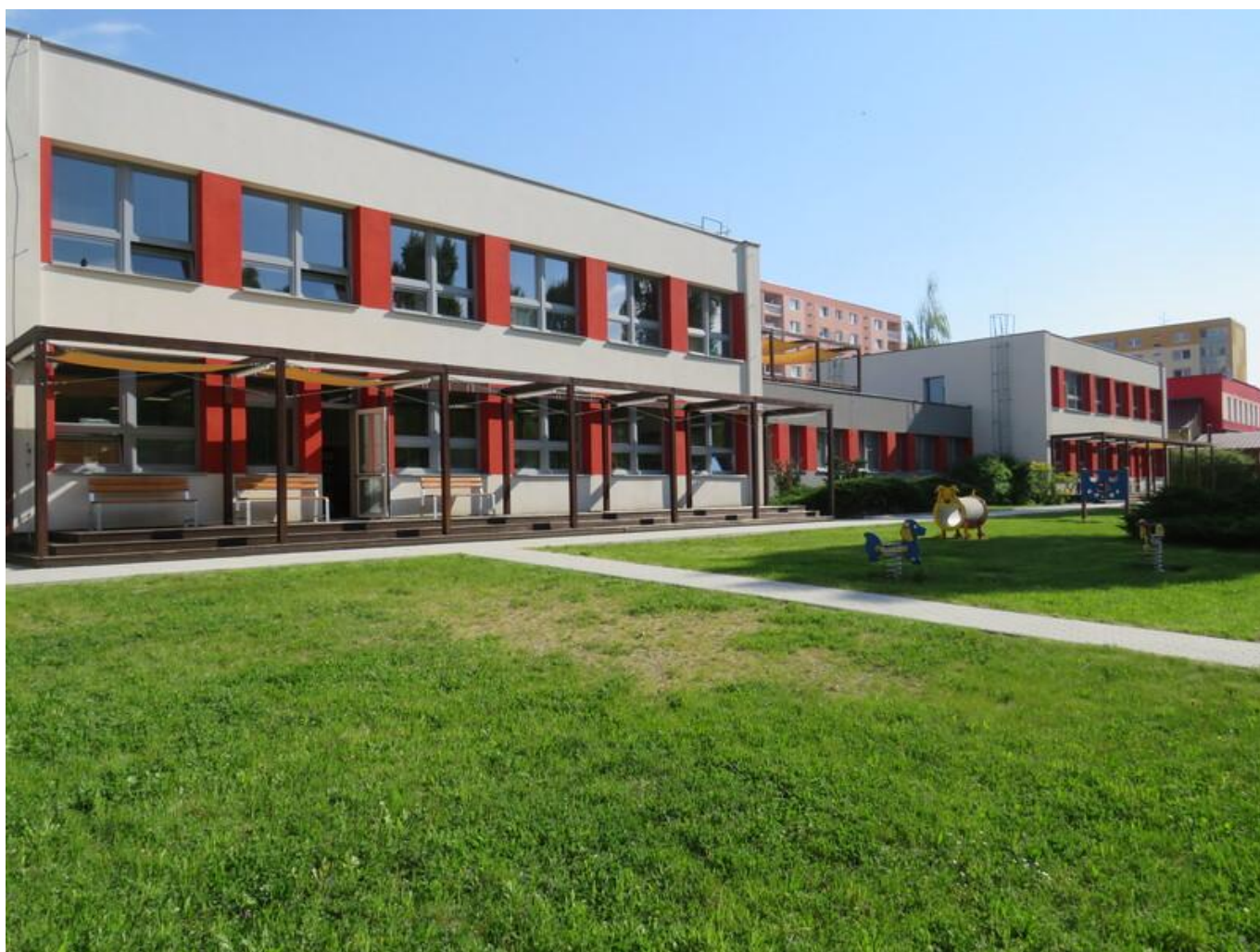
[24] Zahrada s pergolou

Přilehlá zahrada poskytuje venkovní sezení pod pergolou a zajímavostí mohou být cvičné chodníčky a cesty s různým povrchem pro trénování pohybu v různých prostředích.