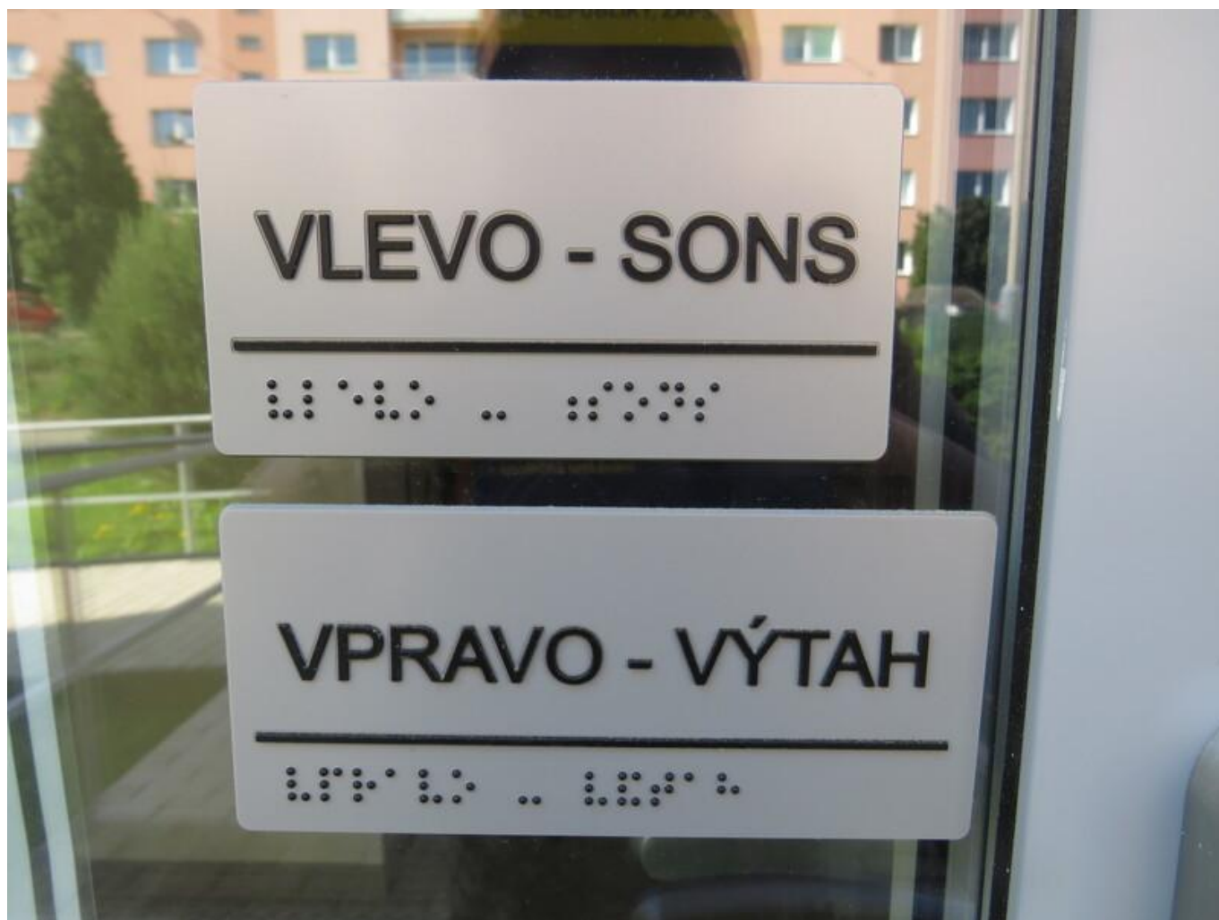
[22] Ukázka informačního systému