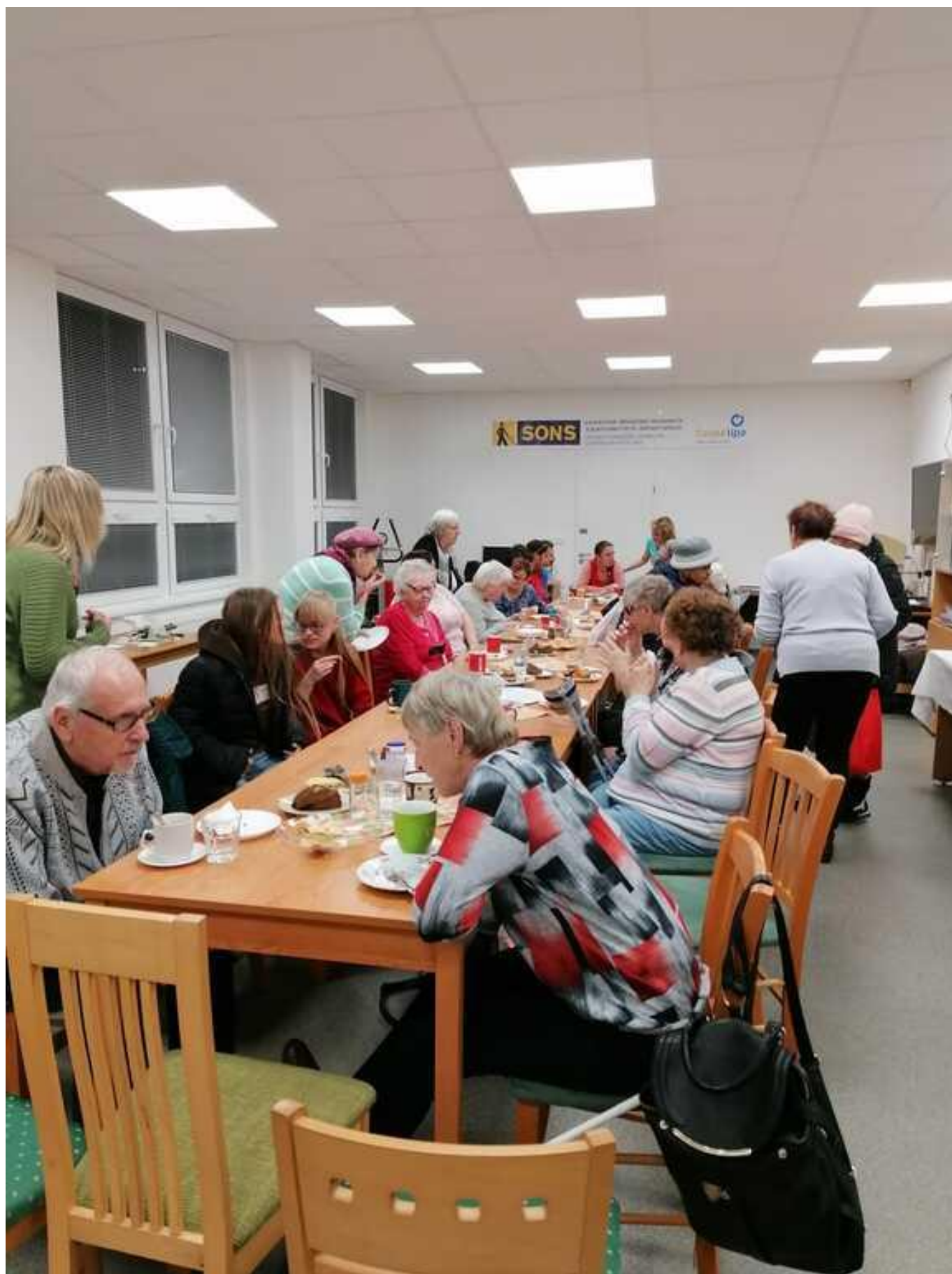
[14] Ze slavnostního setkání u příležitosti 20 let spolupráce (listopad 2022)