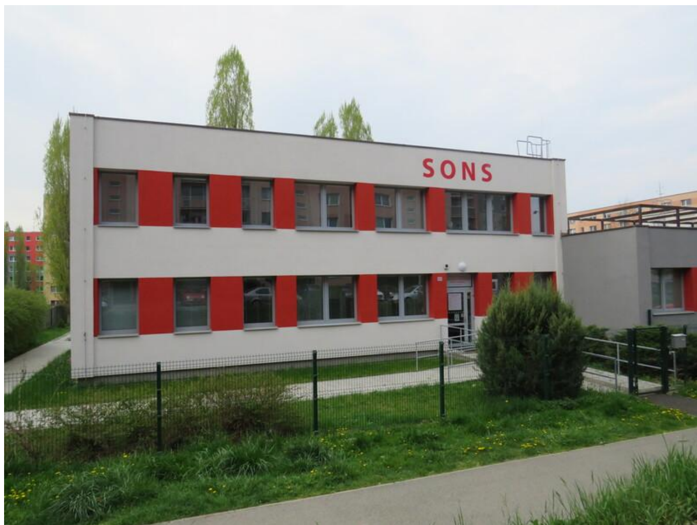
[19] Detail části budovy, v níž sídlí českolipská odbočka SONS