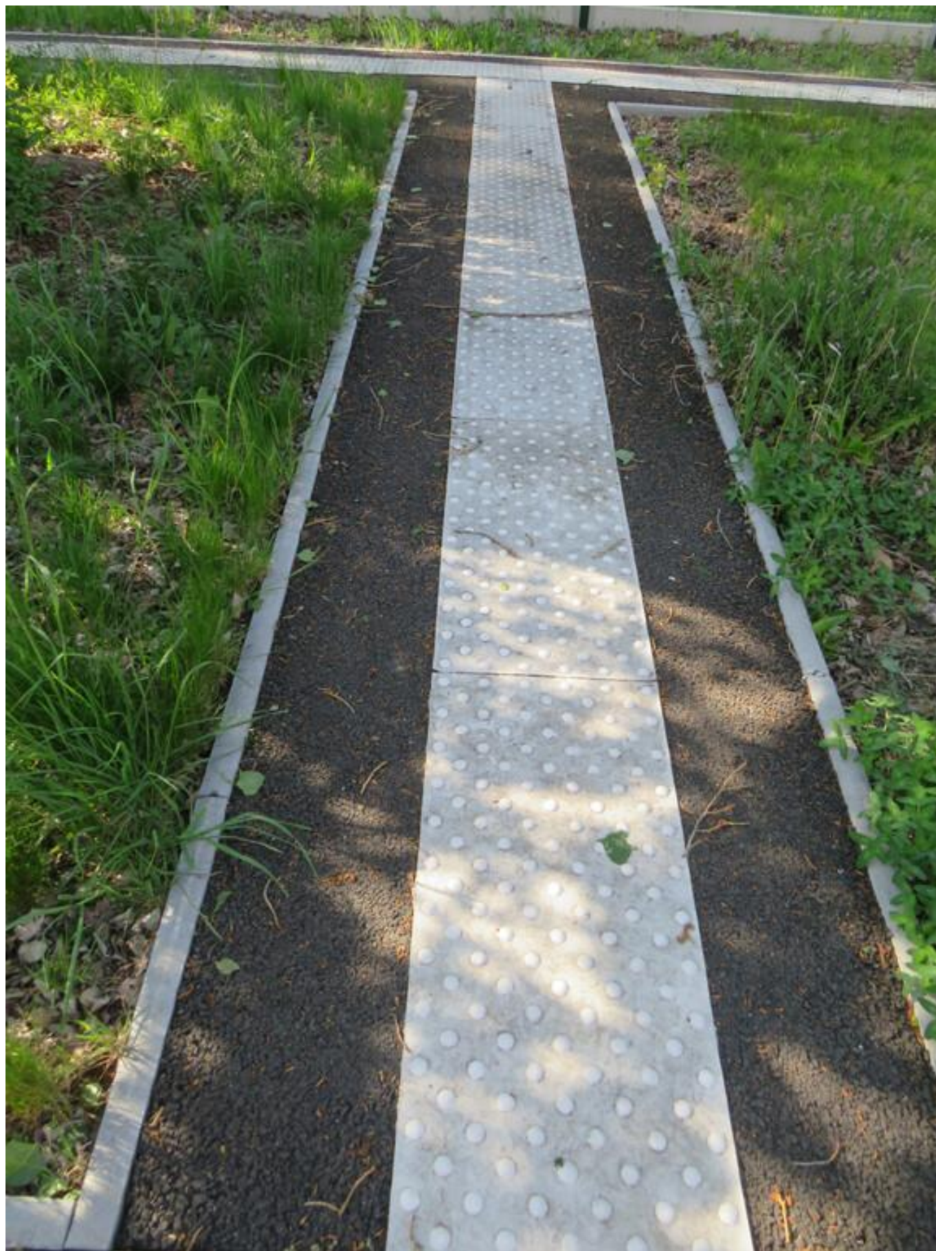
[30] Cvičné dráhy pro nevidomé