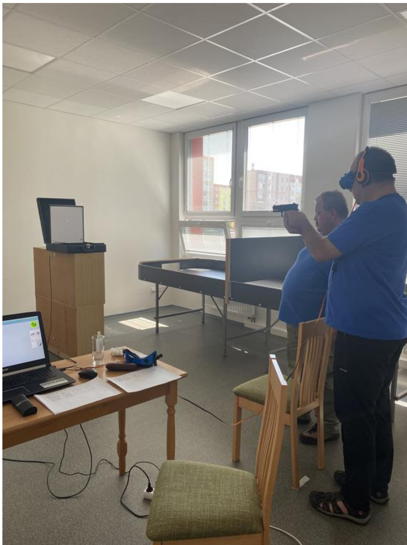
[23] Akustická střelba (září 2021)