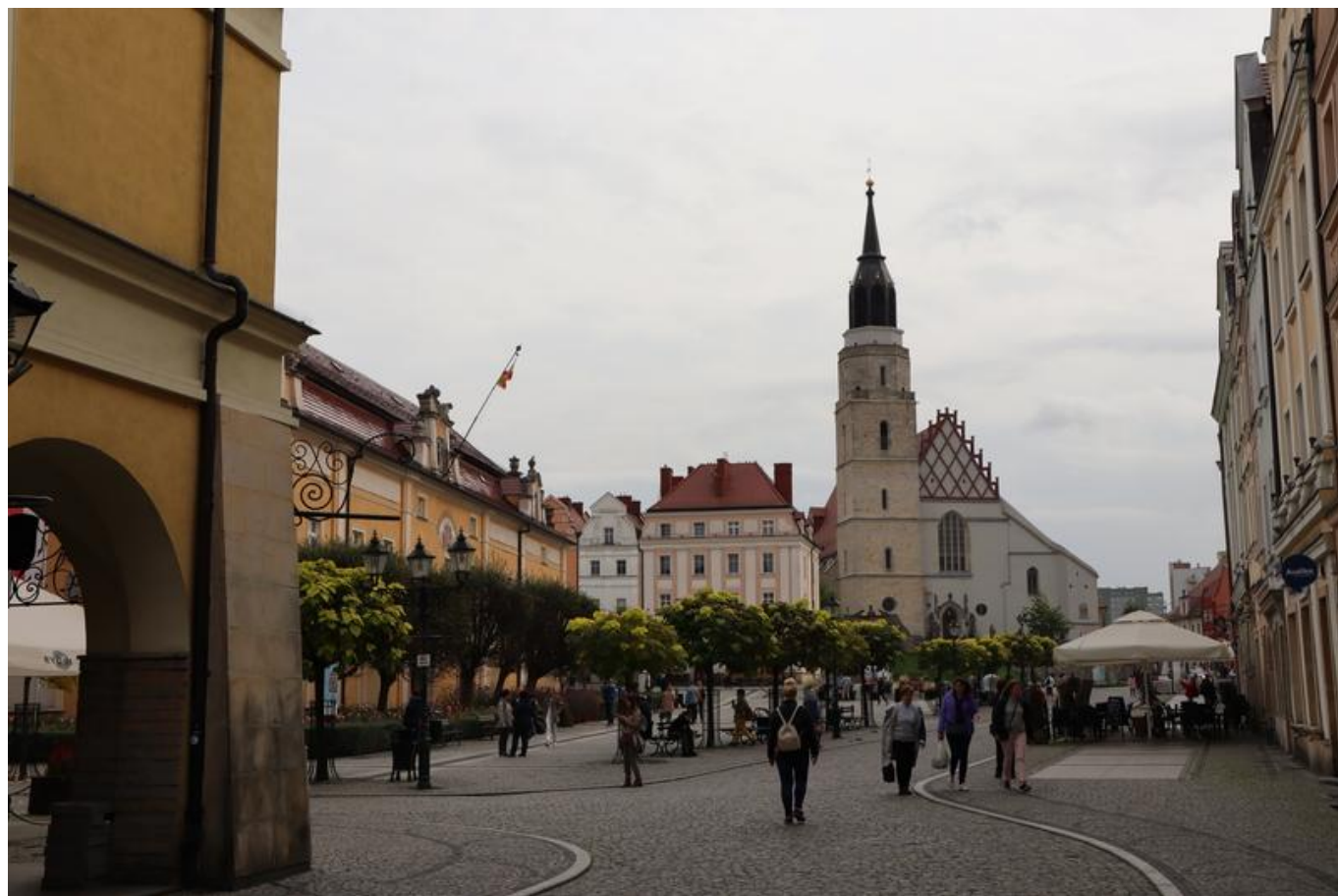
[17] Pohled na boleslavecké náměstí