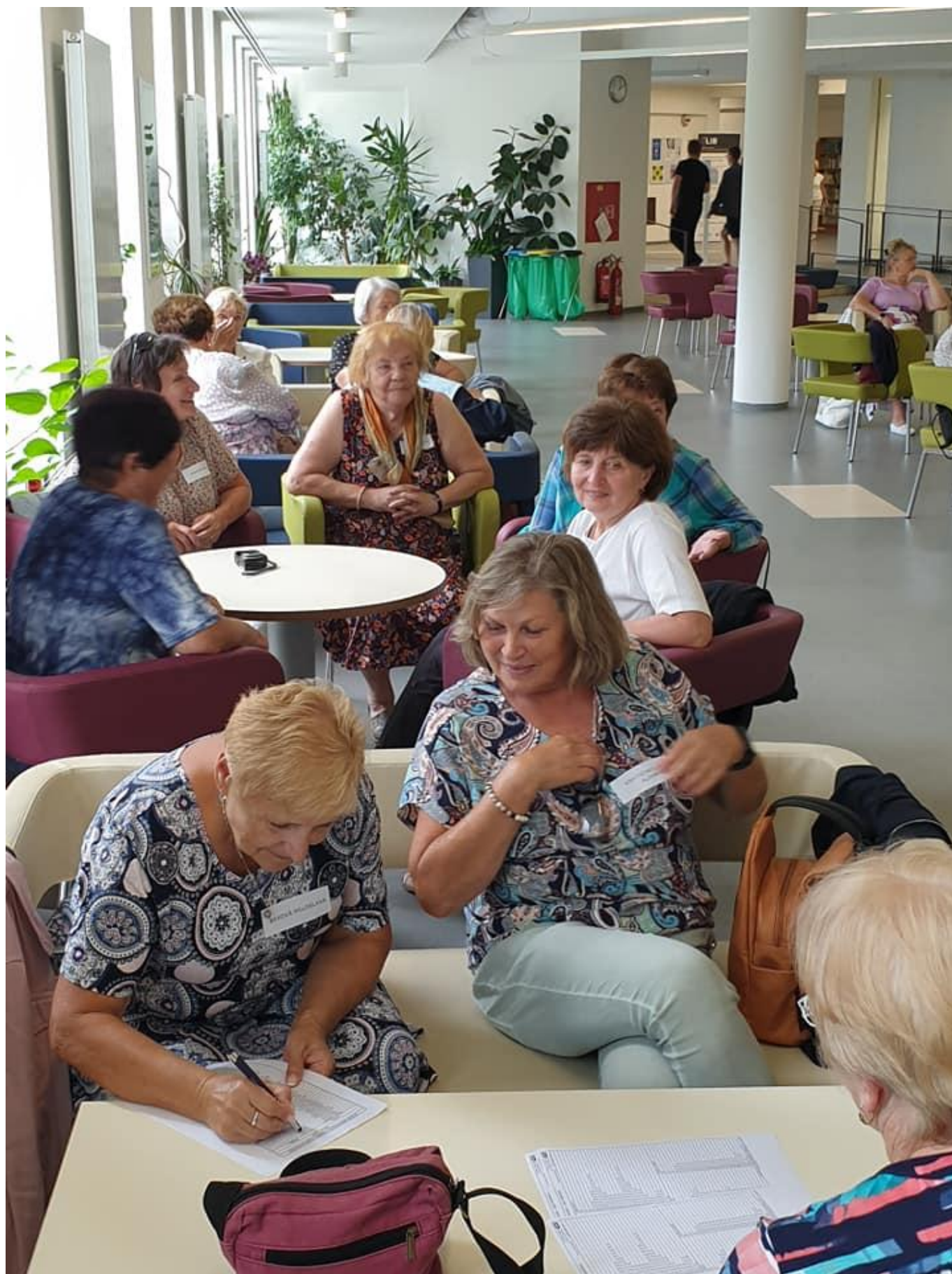
[16] Účastníci setkání